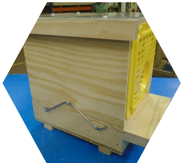
Piège nasse à grilles Néoppi jaunes