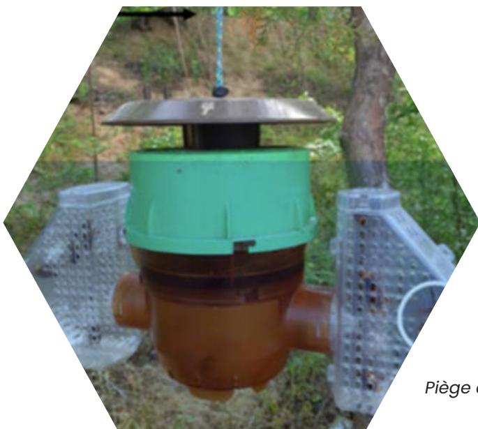
Piège coréen à ailes

Renouveler l'appât au plus tous les 8-10 jours, en laissant quelques frelons vivants à l'intérieur du piège, les phéromones attirent les frelons et repousseraient les autres insectes.