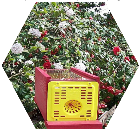
Piège chez un particulier